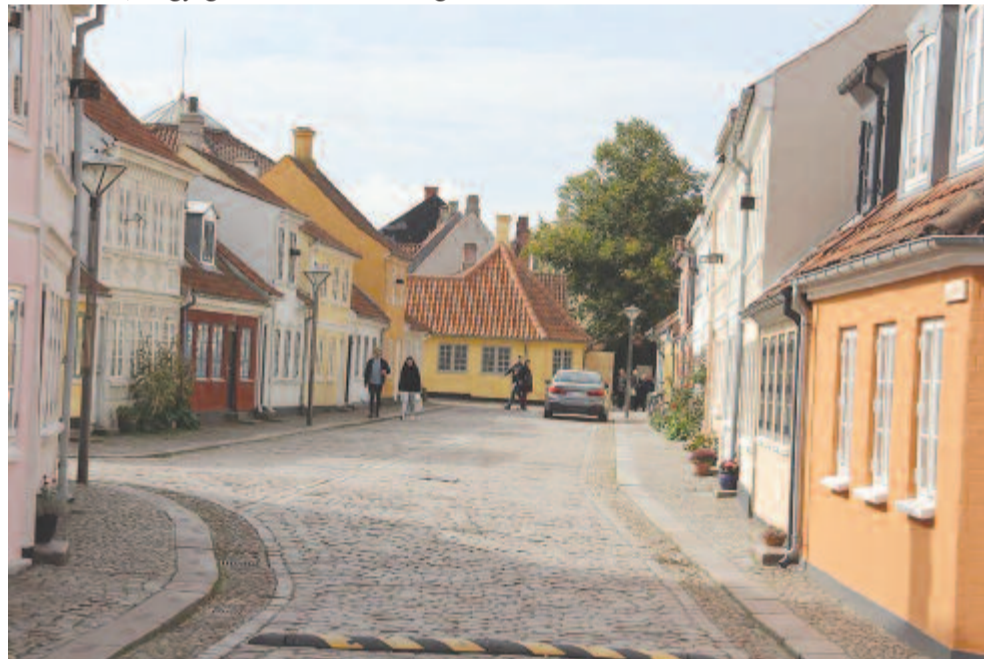
Odense festői utcái

zon. Minderre Európában adatott meg leginkább a lehetőség. Csakhogy a folytonos fejlődésnek is megvannak a maga árnyoldalai, ugyanis mi, európaiak oda süllyedtünk, hogy előrehaladás alatt csakis az anyagi gyarapodást értjük, és megfeledkezünk a szellemi és lelki feltöltődésről, amelyhez sok más mellett hozzátartozik a hitünk is. Már csak papírforma szerint – vagy még úgy sem – tartjuk keresztyéniségünket. Elfordultunk Istentől, s miközben magunkat és az egónkat helyezzük mindenek elé, nem látunk már mást, csak a pénzistent. Ezért nem fontos a család, nem fontos a gyermekvállalás, hiszen mindezek csak hátráltatják saját karrierünk kibontakozását, kielégíthetetlen egónk érvényesülését. Miért fordultunk el Istentől és a krisztusi tanításoktól? Miért váltunk családcentrikus emberekből individualistákká? Azért, mert ezek követése és betartása rendkívül nehéz, felelősségteljes és nem összeegyeztethető nyelge és kényelmes életstílusunkkal. Ezért is van az, hogy sok európai – akikben maradt mégis némi hajlam a spiritualizmusra – inkább a keleti tanokban keresi önmagát. Csakhogy, amíg mi az élet kényelmesebb oldalát választjuk, addig észre sem vesszük, hogy életképebb, saját hitüket komolyabban gyakorló népek szűrődnek be egyre nagyobb számban féltett kontinensünkre, és csak akkor fogunk felocsúdni, ami-