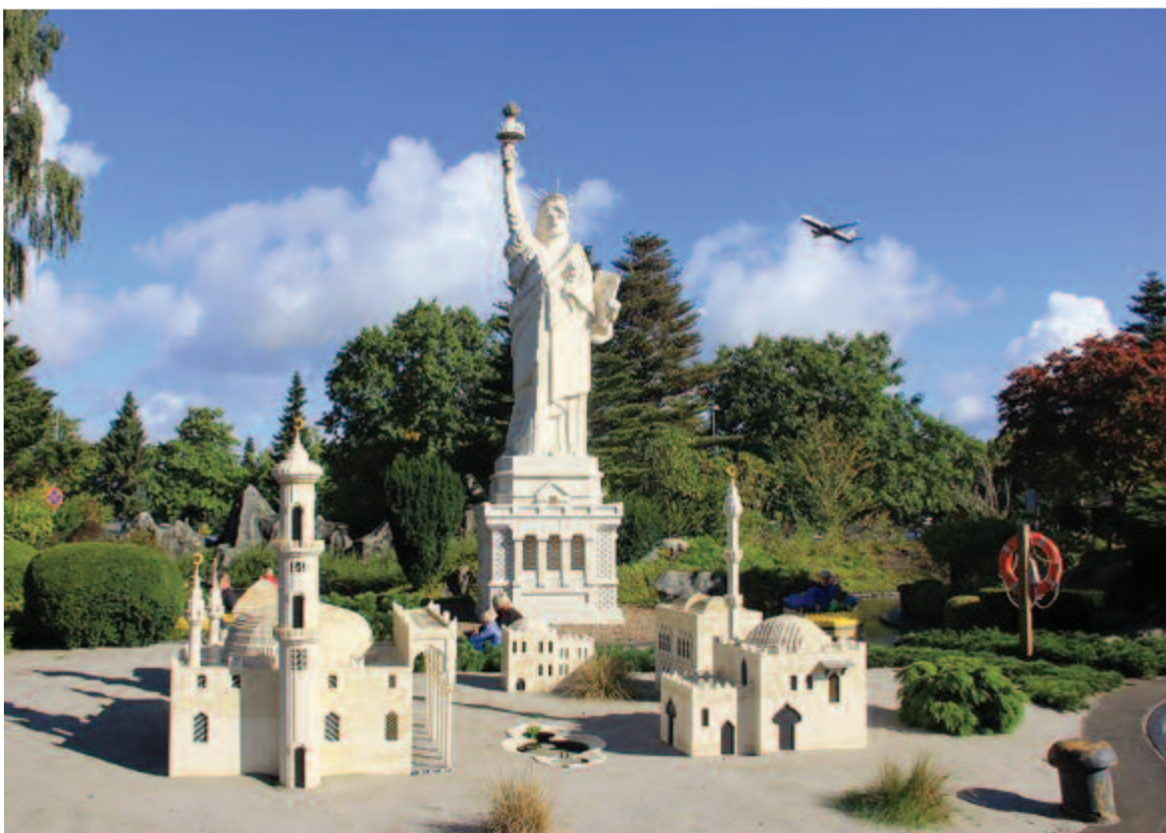
Legoland – iszlám mecsetek a Szabadság-szobor árnyékában

Sajnos ma még túl kevés európai politikus követi a magyar mintát, ezért kétséges, hogy emberöltők múlva a dániai Legoland megmarad a jólét szimbólumának, de az sem biztos, hogy lesz ki emlékezzen H. C. Andersenre vagy Benedek Elekre.