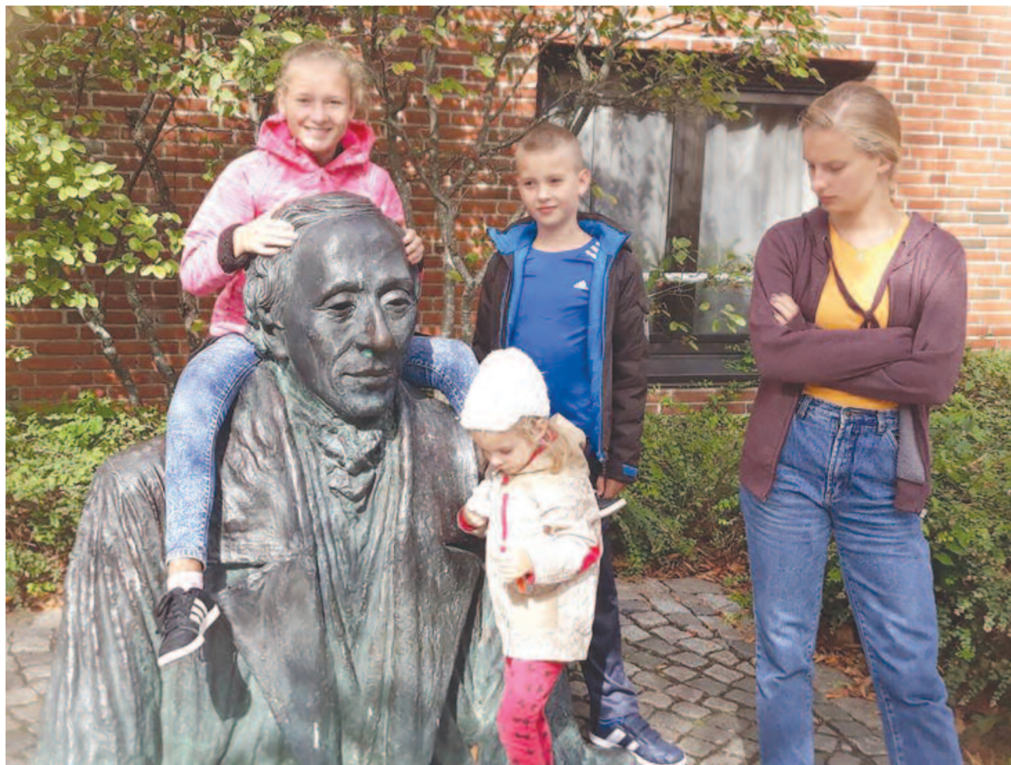
Andersen szobránál Odensében